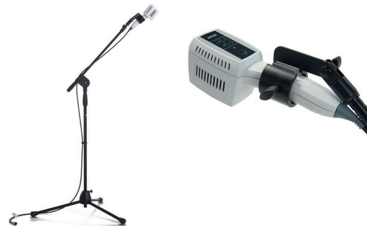
Sprchový aplikátor CL na stativu